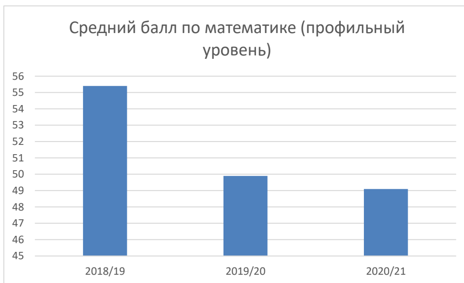
Диаграмма 2. Результаты ГИА по математике профильного уровня в форме ЕГЭ в сравнении за последние три учебных года:

По результатам сдачи ГВЭ по математике (базовый уровень) в 2021 году средний балл невысокий из-за большого количества учеников, сдавших экзамен ниже среднего. Низкий процент учеников, получивших высокие баллы, обусловлен общим уровнем знаний учащихся, который в основном соответствует итоговым отметкам по предмету . Обобщенные данные представлены в таблице 3.