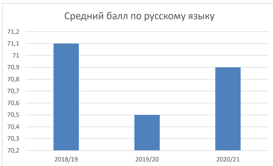
Диаграмма 1. Результаты ГИА по русскому языку в форме ЕГЭ в сравнении за последние три учебных года

По результатам сдачи ГВЭ по русскому языку в 2021 году средний балл невысокий из-за большого количества учеников, сдавших экзамен ниже среднего. Низкий процент учеников, получивших высокие баллы, обусловлен общим уровнем знаний учащихся, который в основном соответствует итоговым отметкам по предмету. Обобщенные данные представлены в таблице 2.