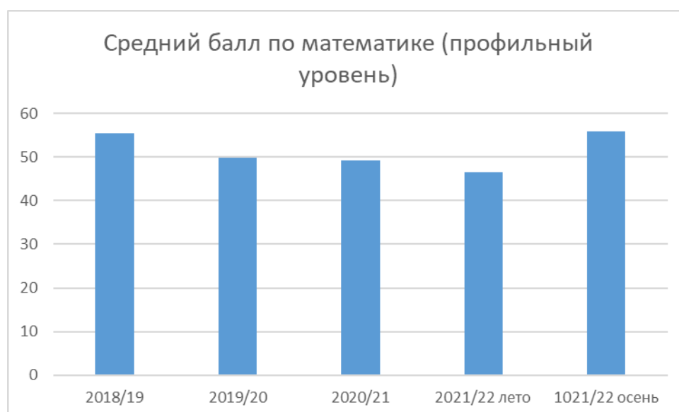
Диаграмма 2. Результаты ГИА по математике профильного уровня в форме ЕГЭ в сравнении за последние четыре учебных года:

По результатам сдачи экзамена по математике (базовый уровень) в 2022 году средний балл невысокий из-за большого количества учеников, сдавших экзамен ниже среднего.