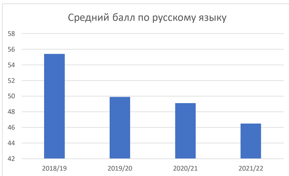
Диаграмма 1. Результаты ГИА по русскому языку в форме ЕГЭ в сравнении за последние четыре учебных года

В целом результаты сдачи ГИА по русскому языку в 2022 году показали, что количество выпускников, которые получили на экзамене высокие баллы, составило 19 человек (23,1% от общего количества участников ГИА по предмету), выше среднего – 63 человека (77%), ниже среднего – 0 человек, ниже минимального – 0 человек. Средний балл по школе – 68,7. Все пять выпускников, претендующих на получение медали «За особые успехи в учении», прошли минимальный порог в 70 баллов на ЕГЭ по русскому языку.